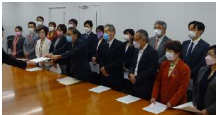
党市議団が市長に対して緊急の申し入れ

市としてできることは、「行財政改革計画」にもとづいて実施しようとしている、市民へのあらゆる痛み押し付けをやめることです。すでに「毎年500億円」の財源不足で「財政が破たんする」との市